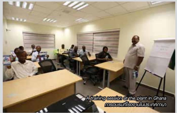
A training session at the plant in Ghana การอบรมที่โรงงานในประเทศกานา

With our effort and outstanding commitment to anti-corruption practices, Indorama Ventures has received CAC Certification in October 2014. It is a great achievement and reflects the excellent anti-corruption awareness and enthusiasm of our company. We will continue to maintain and develop our proactive standards to ensure that our commitment and practices are implemented in the spirit that they were created. Fighting against corruption is part of an integrated framework and management needs full cooperation. To help implement our anti-corruption policy and promote Indorama Ventures to be an anti-corruption-driven organization, we need all employees to undertake to be responsible for its success and to individually uphold ethics-related policies and encourage everyone else to do the same.