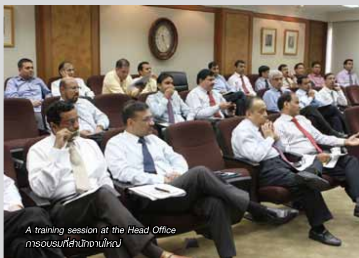
A training session at the Head Office การอบรมที่สำนักงานใหญ่

ด้วยความพยายามและความมุ่งมั่นอย่างแรงกล้าของเราต่อการปฏิบัติด้านการต่อต้านการทุจริต อินโดรามา เวเนเจอร์สได้รับการรับรองเป็นสมาชิกแนวร่วมปฏิบัติของภาคเอกชนไทยในการต่อต้านการทุจริตในเดือนตุลาคม 2557 ซึ่งถือได้ว่าเป็นความสำเร็จอย่างมาก และยังคงสะท้อนให้เห็นถึงการสร้างความตระหนักและการตื่นรู้ในการต่อต้านการทุจริตของบริษัทฯ ได้เป็นอย่างดี เรายังคงรักษาและพัฒนามาตรฐานอย่างต่อเนื่อง เพื่อให้เกิดความมั่นใจในความมุ่งมั่นและการปฏิบัติมีความสอดคล้องกับแนวทางที่เรากำหนด การต่อสู้กับการทุจริตเป็นเพียงแค่ส่วนหนึ่งของกรอบการทำงานแบบบูรณาการ อีกทั้งการบริหารจัดการก็ต้องการความร่วมมืออย่างเต็มกำลัง การนำนโยบายการต่อต้านการทุจริตไปปรับใช้และรณรงค์ที่ อินโดรามา เวเนเจอร์ส เป็นองค์กรที่ขับเคลื่อนภายใต้การต่อต้านการทุจริต เราต้องการให้พนักงานทุกคนมีส่วนร่วมในการรับผิดชอบต่อความสำเร็จและส่งเสริมนโยบายที่เกี่ยวข้องกับจรรยาบรรณ อีกทั้งยังช่วยรณรงค์ให้ทุกๆ คนปฏิบัติในแบบเดียวกัน