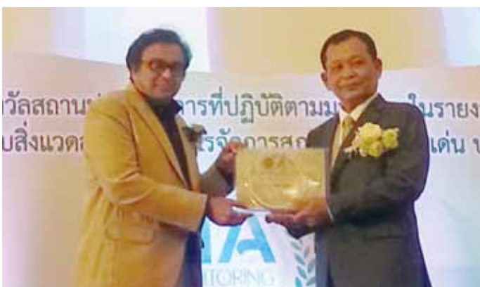
● Asia Pet (Thailand) received the Environmental Impact Assessment (EIA) Monitoring Award 2014 presented by the Ministry of Natural Resources and Environment Thailand. The award was given to organizations for having an excellent environmental impact assessment report and environmental management.