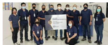
Packaging Vertical Winner: Petform (Thailand), Lopburi, Thailand

ผู้ชนะกลุ่มผลิตภัณฑ์ PET: Indorama Petrochem (PET) จังหวัดระยอง ประเทศไทย