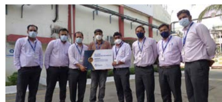
IOD Segment Winner: Indorama Ventures Oxides Ankleshwar, Ankleshwar, India

ผู้ชนะกลุ่มธุรกิจ Packaging: Petform (Thailand) จังหวัดลพบุรี ประเทศไทย