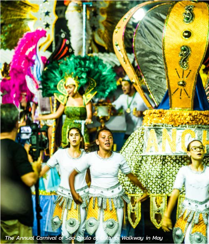
The Annual Carnival of Sao Paulo at Cultural Walkway in May

การเข้าซื้อกิจการ Oxiteno ล่าสุดได้เพิ่มตลาดของโวลีแอลให้มีขนาดใหญ่มากขึ้น โดยบริษัทมีโรงงานผลิตเพิ่มอีกหกแห่งในบราซิล นอกเหนือจากสำนักงานกลางของ Oxiteno ซึ่งตั้งอยู่ในเมืองเซาเปาโล เมืองเซาเปาโลคือหนึ่งในมหานครที่ยิ่งใหญ่ของโลก เป็นเมืองในฝันของนักท่องเที่ยวในเมืองที่มีสถานบันเทิงยามค่ำคืนที่มีชีวิตชีวา พิพิธภัณฑ์ศิลปะที่สวยงาม อาหารหลากหลายเมนูและแนวชายฝั่งสวยงามที่ไกลแค่เอื้อม และถึงแม้การพูดถึงสถานที่สำคัญของเมืองเซาเปาโลทั้งหมดในวันเดียวจะเป็นเรื่องที่เป็นไปไม่ได้ แต่สถานที่ห้ามพลาดต่อไปนี้คืองานเปิดตัวเริ่มต้นที่ดีสำหรับคนที่อยากไปเที่ยวเมืองนี้ต่อไป