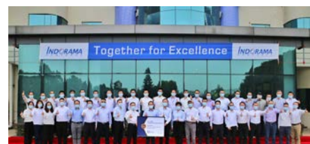
Fibers Segment Winner: Performance Fibers (Kaiping), Kaiping, China

ผู้ชนะกลุ่มผลิตภัณฑ์ Aromatics: Indorama Ventures Quimica เมือง San Roque ประเทศสเปน