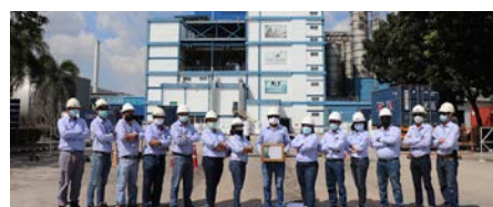
PET Division Winner: Indorama Petrochem (PET), Rayong, Thailand

ผู้ชนะกลุ่มผลิตภัณฑ์ PET: Asiapet Limited and Indorama Polymers Public Company Limited จังหวัดลพบุรี ประเทศไทย