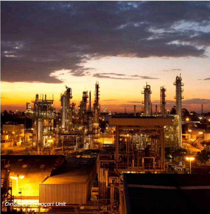
Oxiteno's Camaçari Unit