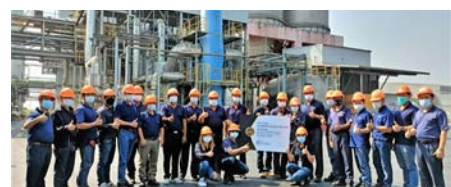
PET Division Winner: Asiapet Limited and Indorama Polymers Public Company Limited, Lopburi, Thailand

การมอบรางวัล IVL Performance Excellence Awards มีขึ้นครั้งแรกในปี 2560 เพื่อยกย่องผู้มีผลงานโดดเด่นจากพื้นที่ปฏิบัติงานทุกแห่งทั่วโลกขององค์กร เป็นความคิดริเริ่มที่สำคัญในการรักษาและพัฒนาการมีส่วนร่วมของพนักงานที่มุ่งเน้นการสร้างแรงบันดาลใจให้พนักงานเกิดความภาคภูมิใจและสามารถก้าวข้ามขอบเขตข้อจำกัด โดยมีการพิจารณาจากผลการดำเนินงานที่โดดเด่นใน 10 หลักเกณฑ์บนพื้นฐานของผลการดำเนินงานด้านการเงิน ผลการดำเนินงานเชิงปฏิบัติ และผลการดำเนินงานด้านความยั่งยืน รางวัลนี้ด้วยกันทั้งสิ้น 8 ประเภท โดยมีการประกาศรายชื่อผู้ชนะในการประชุม Group Management Conference (GMC) 2022 ที่จัดขึ้นในเดือนมกราคมที่ผ่านมา ดังนี้