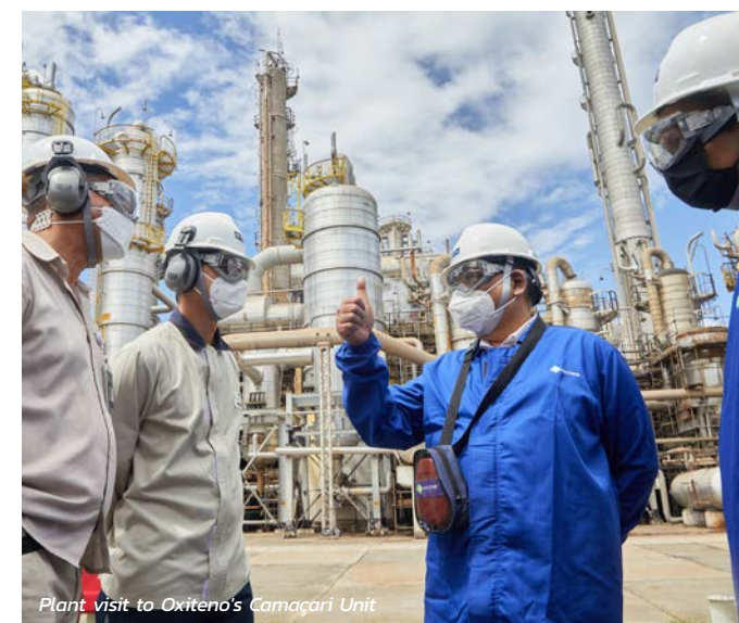
Plant visit to Oxiten's Camaçari Unit

การเข้าซื้อกิจการครั้งนี้ประกอบด้วยโรงงานผลิต 11 แห่งในลาตินอเมริกาและสหรัฐอเมริกา ศูนย์วิจัยและพัฒนา 5 แห่ง ทีมบริหารที่มีประสบการณ์ ประวัติการบริหารสิ่งแวดล้อมที่แข็งแกร่ง และความเชี่ยวชาญด้านนวัตกรรมที่เป็นมิตรต่อสิ่งแวดล้อม โดย Oxiten ได้เข้าเป็นส่วนหนึ่งในกลุ่มธุรกิจ Integrated