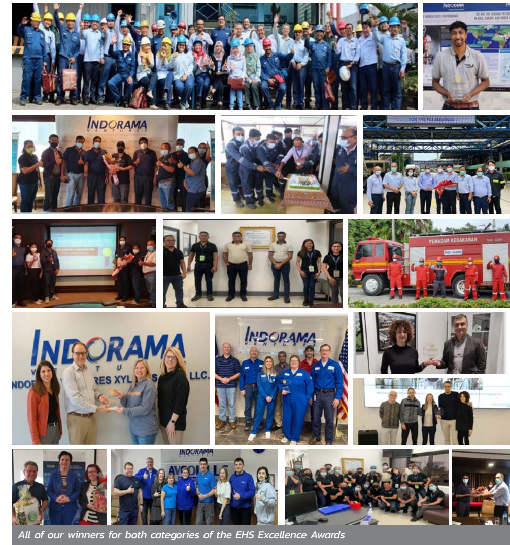
All of our winners for both categories of the EHS Excellence Awards

ในการประกาศรางวัล มีการเสนอชื่อผู้เข้าชิงรางวัลมากถึง 91 รายชื่อจากทุกกลุ่มธุรกิจของบริษัทฯ สะท้อนถึงความสามารถและแรงผลักดันที่แข็งแกร่งภายในบริษัทฯ ที่มีต่อเรื่องนี้ และถึงแม้จะมีรางวัลอยู่เพียง 2 ประเภท แต่บุคคลหรือทีมที่ได้รับการเสนอชื่อนี้มาล้วนเป็นตัวอย่างอันดีที่ช่วยสะท้อนว่าทุกคนภายในองค์กรสามารถสร้างผลกระทบเชิงบวกผ่านความสามารถในการสร้างวัฒนธรรม EHS ให้มีขึ้นในไซต์งานแต่ละแห่งที่มีความแตกต่างกันได้