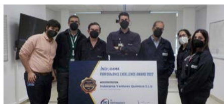
Aromatics Division Winner: Indorama Ventures Quimica, San Roque, Spain

ผู้ชนะกลุ่มธุรกิจ IOD: Indorama Ventures Oxides Ankleshwar เมือง Ankleshwar ประเทศอินเดีย