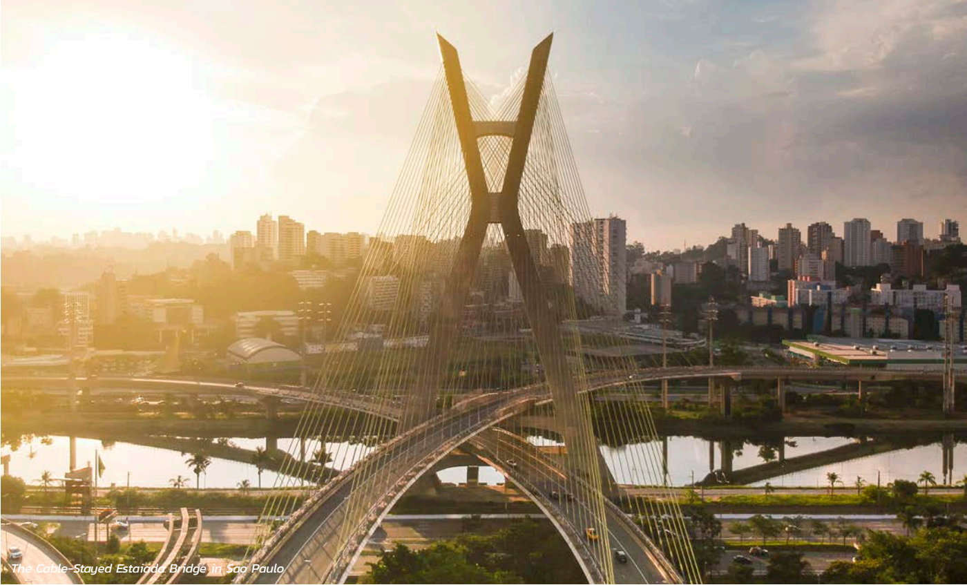
The Cable-Stayed Estaiada Bridge in Sao Paulo