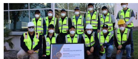
Recycling Business Winner: Indorama Ventures Sustainable Solutions, Alabama, U.S.A

ผู้ชนะกลุ่มธุรกิจ Packaging: Petform (Thailand) จังหวัดระยอง ประเทศไทย