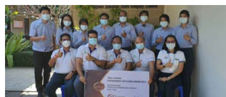
Packaging Vertical Winner: Petform (Thailand), Rayong, Thailand

ผู้ชนะกลุ่มธุรกิจ Fibers: Performance Fibers (Kaiping) เมือง Kaiping ประเทศจีน